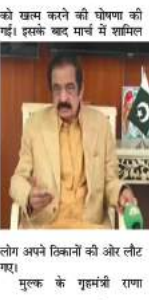
लोग अपने ठिकानों की ओर लौट गए। मुल्क के गृहमंत्री राणा

लाहौर। पाकिस्तान की शहबाज शरीफ सरकार ने आखिरकार कट्टरपंथी संगठन तहरीक-ए-लब्बैक पाकिस्तान (टीएलपी) के सामने घुटने टेक दिए। सरकार ने 'पाकिस्तान बचाओ मार्च' का नेतृत्व कर रहे टीएलपी से समझौता करते हुए ईश निंदा के मामलों में आतंकवाद फैलाने की धारा जोड़ने का भी फैसला किया है। यह जानकारी स्थानीय मीडिया रिपोर्टों में गुजर चुकी है। टीएलपी का यह मार्च 22 मई को कराची से शुरू हुआ था। समझौते के बाद लाहौर से करीब 200 किलोमीटर दूर गुजरात जिले के सराय अकलमगोर में मार्च