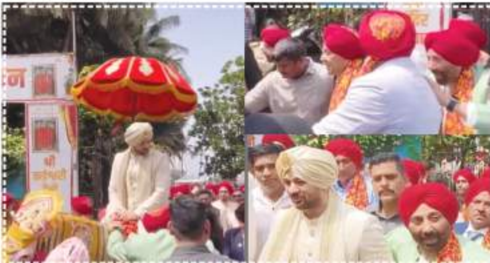
कलर के कोट-पैट में अपने पोते की बारात में नजर आए। उन्होंने भांगड़े पर डांस भी किया।

करण देओल की बारात में धर्मेंद्र भी सज-धज कर पहुंचे। धर्मेंद्र ब्राउन