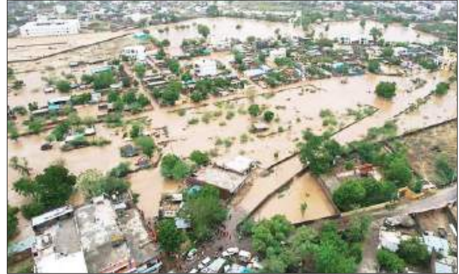
भारी बारिश के बाद राजस्थान के कई इलाकों में भरा पानी।

टीएम एक्शन इंडिया/नई दिल्ली प्रधानमंत्री नरेंद्र मोदी का अमेरिकी दौरा 21 जून से शुरू हो रहा है। पीएम मोदी का ये दौरा कई मायनों में काफी अहम माना जा रहा है। इस यात्रा के बारे में विदेश सचिव ने पीएम मोदी के पूरे शेड्यूल की जानकारी देते हुए कहा कि प्रधानमंत्री नरेंद्र मोदी अमेरिकी राष्ट्रपति जो बाइडेन व प्रथम महिला जिल बाइडेन के निमंत्रण पर 21-23 जून तक अमेरिकी यात्रा पर रहेंगे। विदेश सचिव विनय मोहन क्वात्रा ने पीएम मोदी के अमेरिकी यात्रा की जानकारी दी।