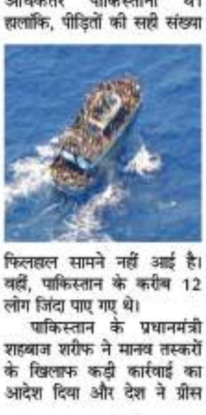
फ्लिहल सामने नहीं आई है। वहीं, पाकिस्तान के करीब 12 लोग जिंदा पाए गए थे। पाकिस्तान के प्रधानमंत्री शहबाज शरीफ ने मानव तस्करी के खिलाफ कड़ी कार्रवाई का आदेश दिया और देश ने ग्रीस

इस्लामाबाद। पाकिस्तान सरकार लगातार मानव तस्करी पर शिकंजा कस रहा है। इसी को लेकर पाकिस्तान के अलग-अलग हिस्सों से करीब 12 लोगों को गिरफ्तार किया गया है। एक अधिकारी ने स्पष्टकर को बताया कि संघीय सरकार ने हाल ही में हुई ग्रीस नौका तस्करी को देखते हुए मानव तस्करी पर शिकंजा कसा हुआ है। गौरतलब है, ग्रीस नौका तस्करी पाकिस्तान के लोगों के लिए डरावनी घटना था। दरअसल, कुछ दिनों पहले ही यूरोप में अवैध रूप से प्रवेश करने के उद्देश्य से 750 लोगों से भरी नाव ग्रीस के समुद्र में डूब गई थी। इस घटना में मरने वाले लोग