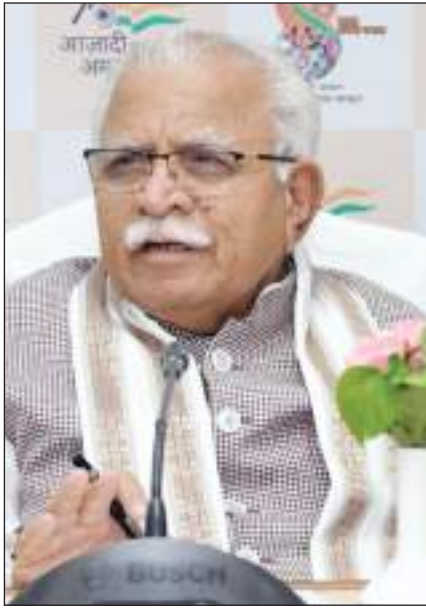
हरियाणा के सीएम मनोहर लाल खट्टर मीटिंग की अध्यक्षता करते हुए।